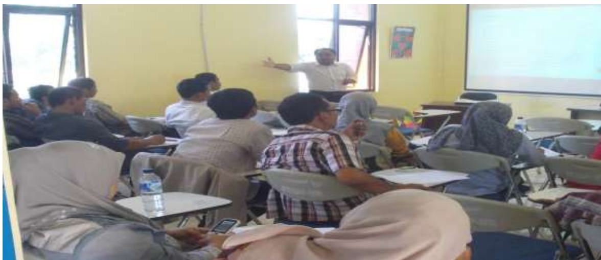
Gambar 3. Foto Pelatihan dan Advokasi Pendampingan Bumdes