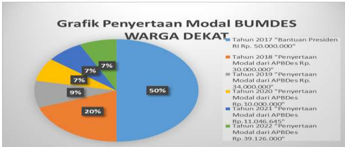
Gambar 1. Grafik Penyertaan Modal Bumdes Warga dekat

Dengan matrik pendapatan keuntungan dari pengelolaan badan usaha milik desa warga dekat yang masuk ke pendapatan asli desa, desa Bandung kecamatan banjar pada tahun 2017 sampai dengan 2023.